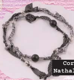
Cortil 12 Nathalie Mélot