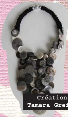
Créations Tamara Greindl