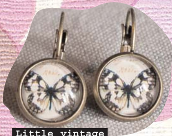
Little vintage lovers