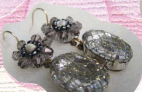
Les bijoux de La petite Broc'