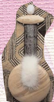
Les bijoux de Renelde